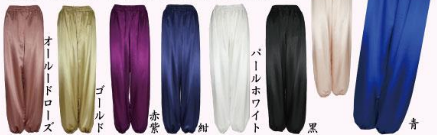
弾力倣絲と弾緞倣ズボン共通サイズ