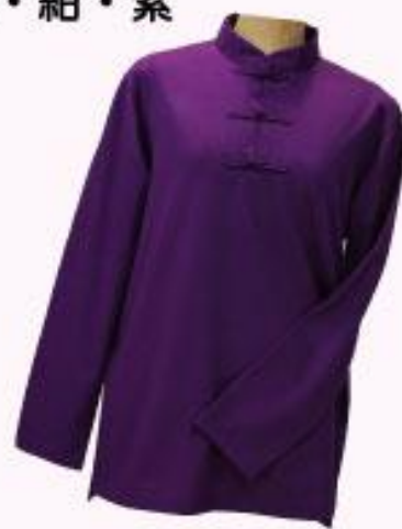
チャイナ風Tシャツサイズ表 (cm)